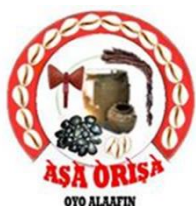
Asa Orisa Alaafin Oyo

Bom meu irmão, Oxum nunca foi iniciada em Ifa. [...] Ifa não é Orixá. Cada um dos Irunmoles iniciaram seus seguidores dentro de seus próprios segredos, assim como Orúnmila iniciou seus seguidores em seus segredos dando-lhes ikin e opele [...] para ajudar a humanidade, assim Xangó, Oxum, Oxalá, etc., iniciaram seus seguidores dentro de seus próprios segredos e deram-lhes os 16 búzios [...].