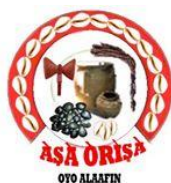
Asa Orisa Alaafin Oyo

De acordo com o que aprendi, todos os orixás no Lukumi fizeram Ifá, exceto Ogun.