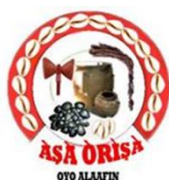
Asa Orisa Alaafin Oyo

Prezado, eu fui muito bem ensinado com relação a odu Ifa.