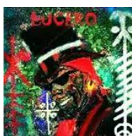
EL Niño Lucero

De acordo com o que aprendi, todos os orixás no Lukumi fizeram Ifá, exceto Ogun.