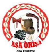
Asa Orisa Alaafin Oyo

Na Iorubalandia se acredita que nós continuamos a aprender até o último suspiro. Se alguém disser que sabe tudo, outros começam aprender onde ele parou. Se eu fosse você, eu me consultaria com outros anciãos sobre este tema. Não se pode ser tudo Mister, especialmente quando se trata de IFA. Eu sei que esta questão será polêmica, e eu avisei. Você precisa pensar sobre a imagem da sua organização que não deve ser manchada. Obrigado!