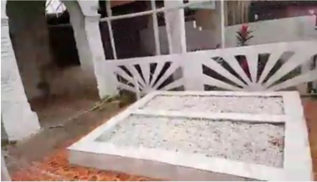
Túmulo da família Atanda.