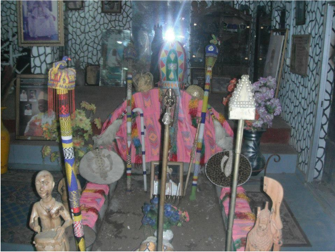
Túmulo dentro de uma casa, em Abeokuta.