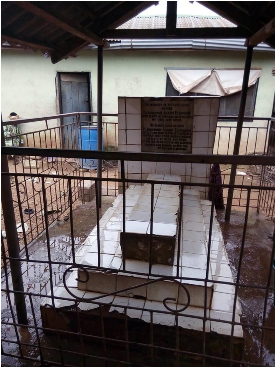
Túmulo da família Elebuibon